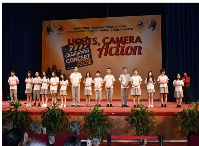
Các em học sinh THCS đạt Giải thưởng học thuật tại Lễ Tổng kết và Biểu diễn văn nghệ cuối năm học