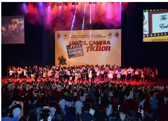
Lễ Tổng kết và Biểu diễn văn nghệ cuối năm học Tiết mục hạ màn