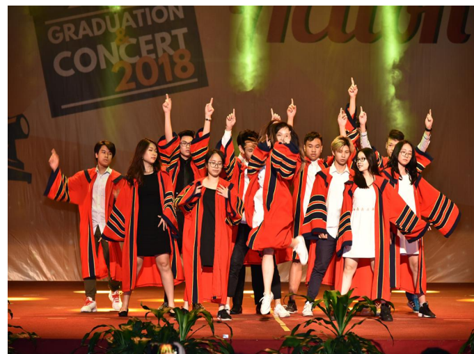
Lễ Tổng kết và Biểu diễn văn nghệ cuối năm học Tiết mục biểu diễn của các em học sinh