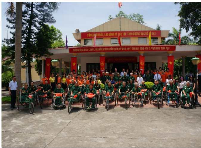
Thầy và trò SIS chụp ảnh lưu niệm cùng các cựu chiến binh tại Trung tâm Duy Tiên - Hà Nam