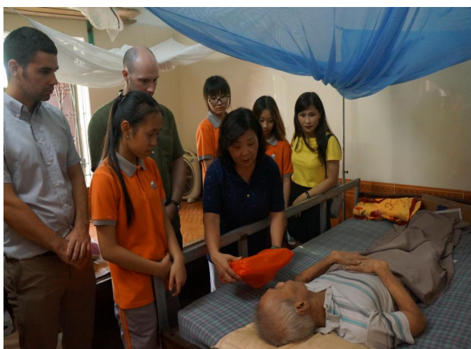
Thầy và trò SIS thăm hỏi và tặng quà cho một cựu chiến binh tại Trung tâm Duy Tiên - Hà Nam

- Có 136 em đạt danh hiệu HS Giỏi, học sinh Tiên tiến và được tặng Giấy khen cuối năm học. Trong đó: có 11 em đạt Danh hiệu Học sinh Giỏi xuất sắc , với thành tích điểm trung bình các môn cả năm là 9,2 trở lên!