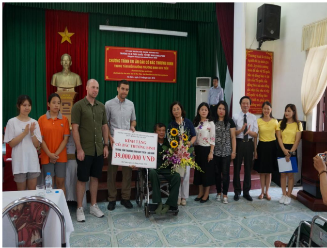
Thầy và trò SIS quyên góp 39.000.000 đồng cho Trung tâm Duy Tiên - Hà Nam