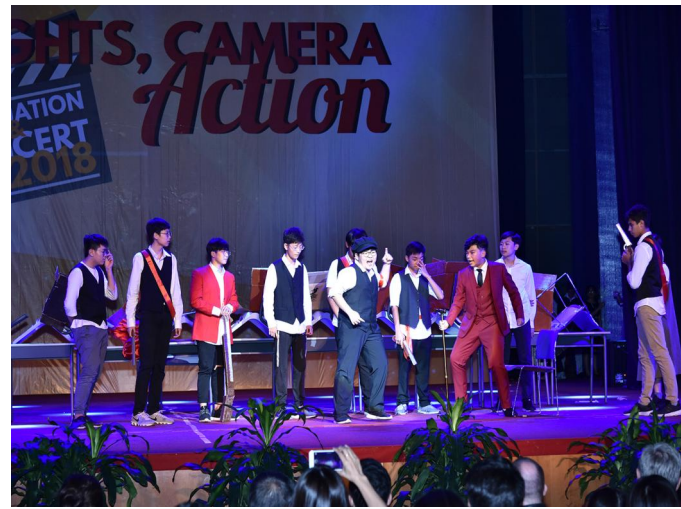
Lễ Tổng kết và Biểu diễn văn nghệ cuối năm học Tiết mục biểu diễn của các em học sinh