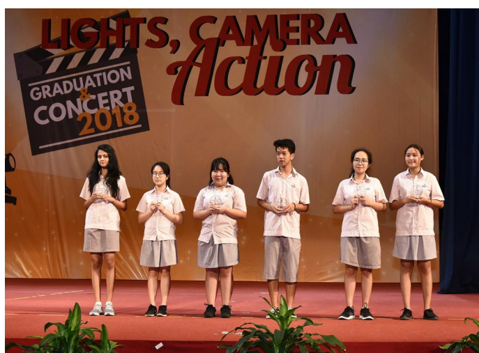
Các em học sinh THPT đạt Giải thưởng học thuật tại Lễ Tổng kết và Biểu diễn văn nghệ cuối năm học