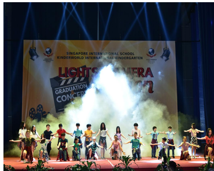
Lễ Tổng kết và Biểu diễn văn nghệ cuối năm học Tiết mục biểu diễn của các em học sinh