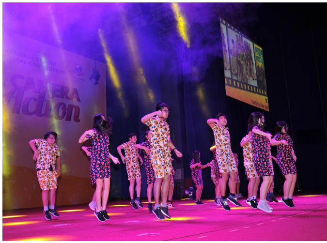
Lễ Tổng kết và Biểu diễn văn nghệ cuối năm học Tiết mục biểu diễn của các em học sinh