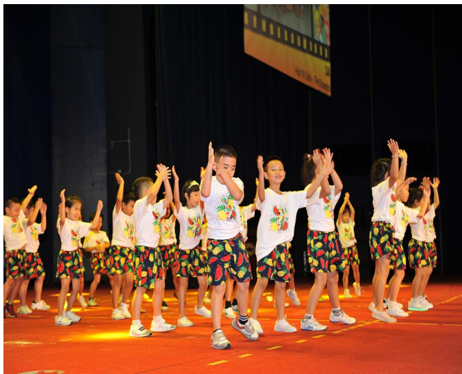
Lễ Tổng kết và Biểu diễn văn nghệ cuối năm học Tiết mục biểu diễn của các em học sinh