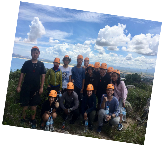
Hoạt động của các em học sinh trong suốt khóa học OBV