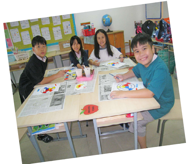
Các em học sinh lớp 3 trong giờ học Khoa học