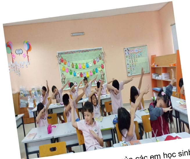
Hoạt động của các em học sinh trong suốt buổi học