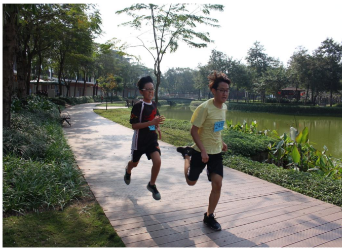
Hội thi chạy việt dã 2018 Học sinh khối Trung học chạy nước rút về đích

thấy các em học sinh đã cố gắng thời gian, tiền bạc, ý tưởng và năng lượng để giúp đỡ những người kém may mắn hơn trong cộng đồng.