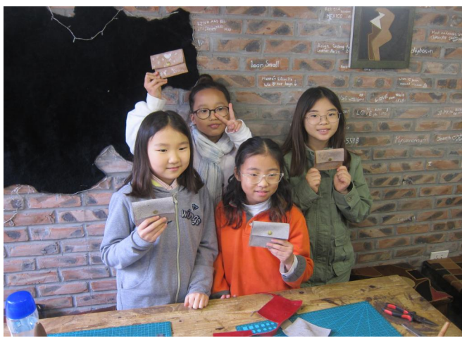
Các em học sinh lớp 4L đang khoe những chiếc ví da do chính các em tự làm