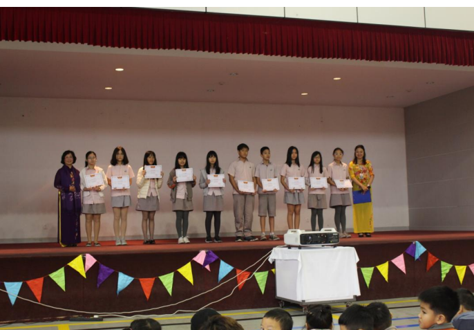
10 học sinh đạt thành tích xuất sắc Học kỳ I cấp THCS khối Song ngữ