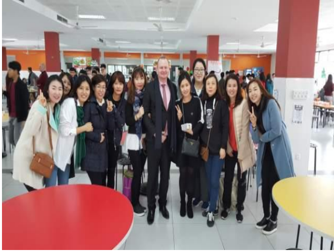
Thầy hiệu trưởng chụp ảnh cùng với Hội các mẹ người Hàn Quốc (Hội chợ Từ thiện Giáng sinh 2017)