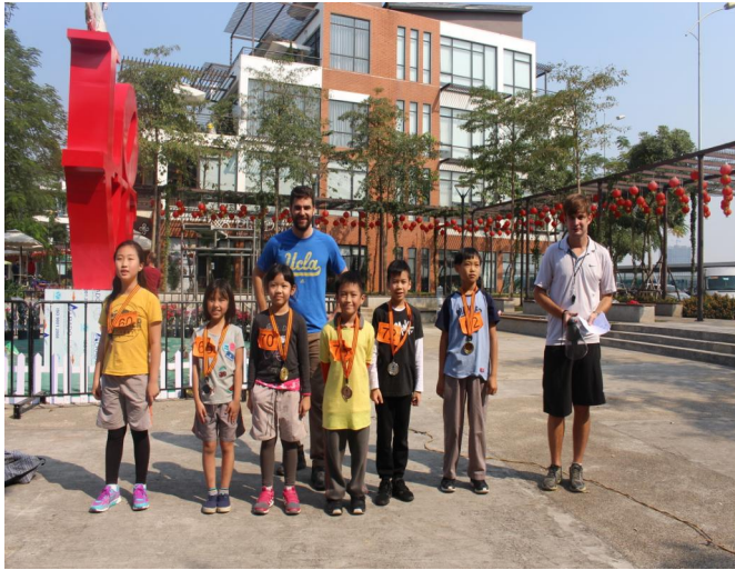
Hội thi chạy việt dã 2018 Những nhà vô địch Lớp 3 khối Tiểu học