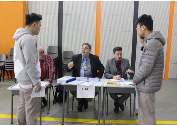
Các giáo viên đang tư vấn cho học sinh về việc lựa chọn môn học