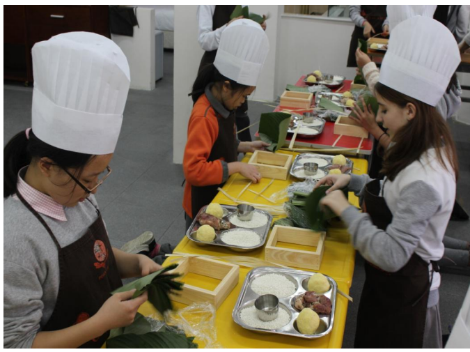
Các em học sinh đang học gói bánh chưng Tết