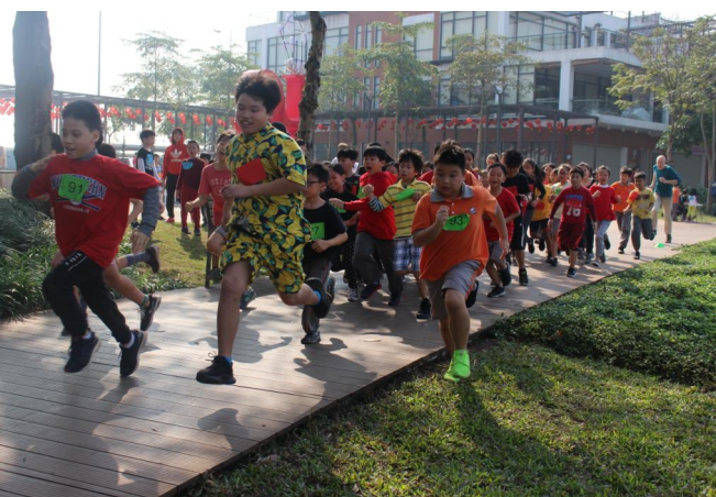
Hội thi chạy việt dã 2018 Học sinh Tiểu học bắt đầu cuộc đua tại vạch xuất phát