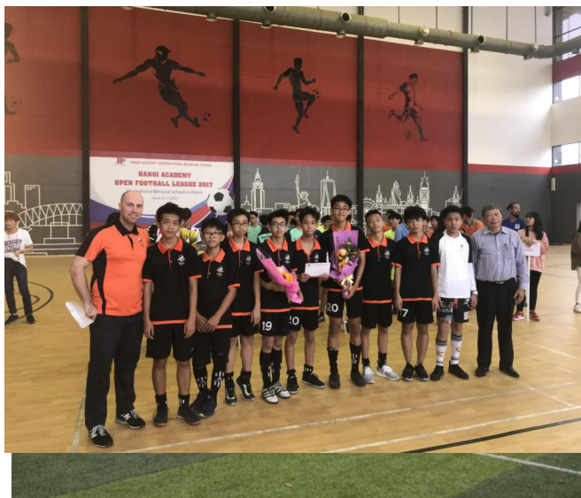
Các cầu thủ bóng đá SIS thi đấu giao lưu tại Hanoi Academy