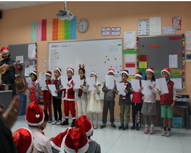
Các em học sinh lớp 1L đang hát bài hát Giáng sinh