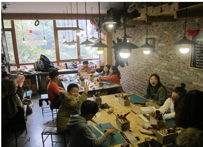
Các em học sinh lớp 4L đang học cách làm hoàn thiện một sản phẩm trong chuyên dã ngoại tới xưởng sản xuất đồ da.