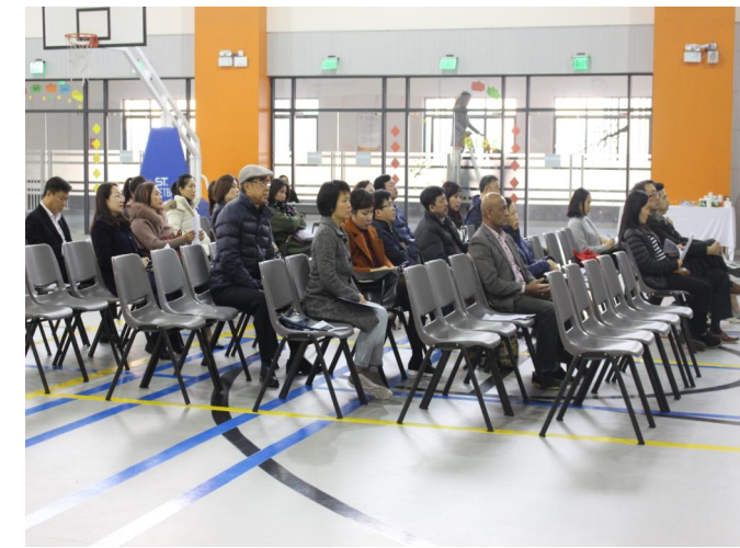
Phụ huynh học sinh Trung học tại Hội thảo Con đường học vấn Trường Quốc tế Singapore