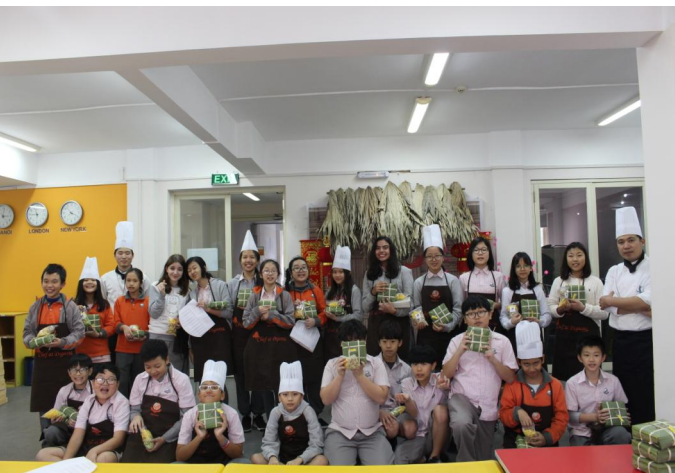
Các em học sinh rất hào hứng khi được mang những chiếc bánh Chưng do mình tự làm về nhà