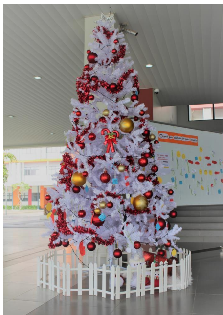
Cây Trao Yêu Thương tại SIS @ Gamuda Gardens

Số tiền quyên góp sẽ dành để mua quà cho và gửi để gửi tặng tổ chức Blue Dragon Foundation