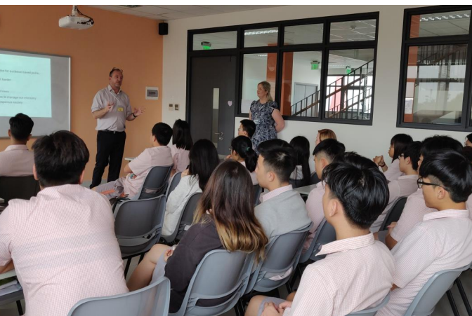
Đại diện đến từ Đại học Melbourne trao đổi thông tin với các em học sinh chương trình GAC, AS và A level