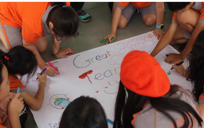
Học sinh tham gia các hoạt động trong chương trình OBV