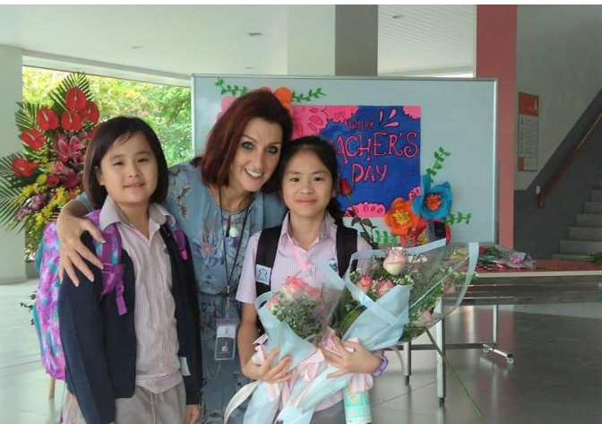
Cô Hiệu trưởng và học sinh trong ngày Nhà Giáo