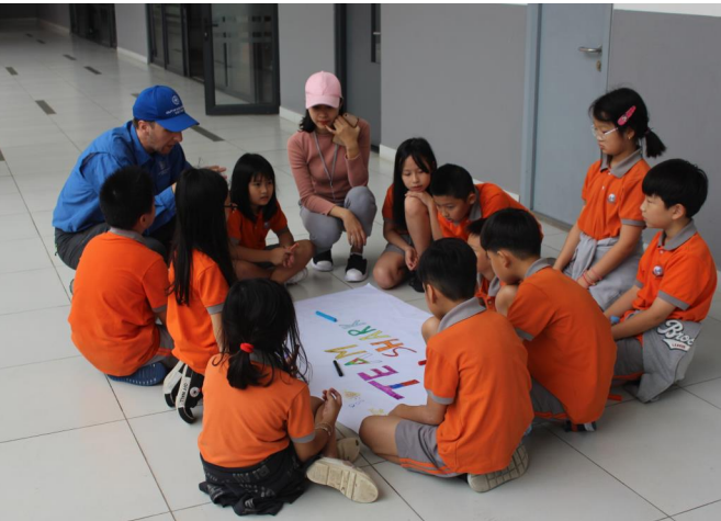
Học sinh lớp 4 tham gia hoạt động xây dựng nhóm trong chương trình OBV