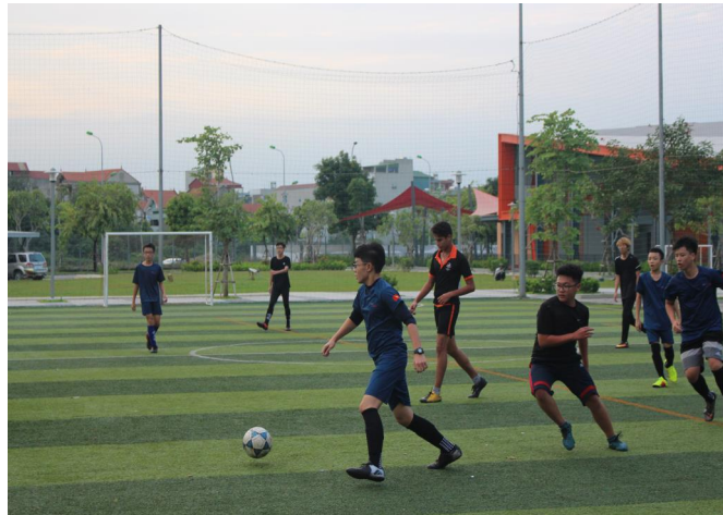
Trận đấu bóng đá giữa SIS và TH School