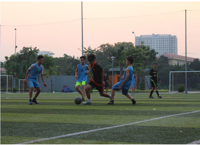
Các nam học sinh đang thể hiện hết mình trên sân cỏ