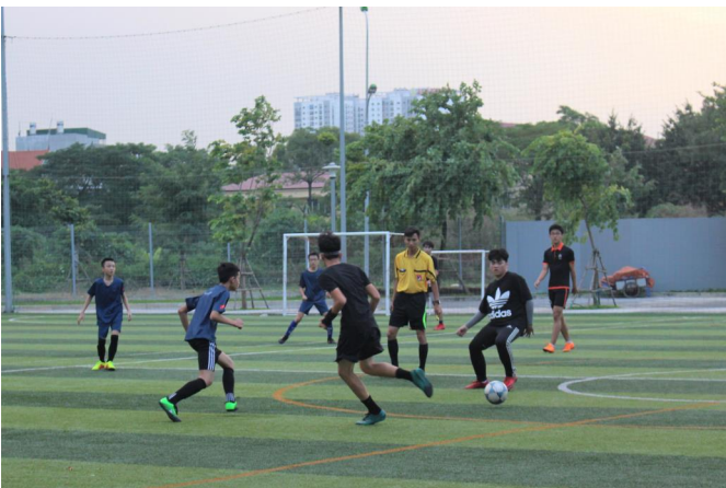
Các học sinh hào hứng thi đấu và thể hiện các kỹ năng chơi bóng xuất sắc