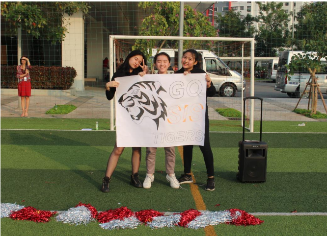
Các học sinh đội trường đội cổ vũ trường SIS