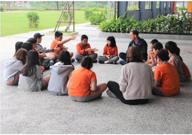
Học sinh trao đổi và chia sẻ ý tưởng trong chương trình OBV