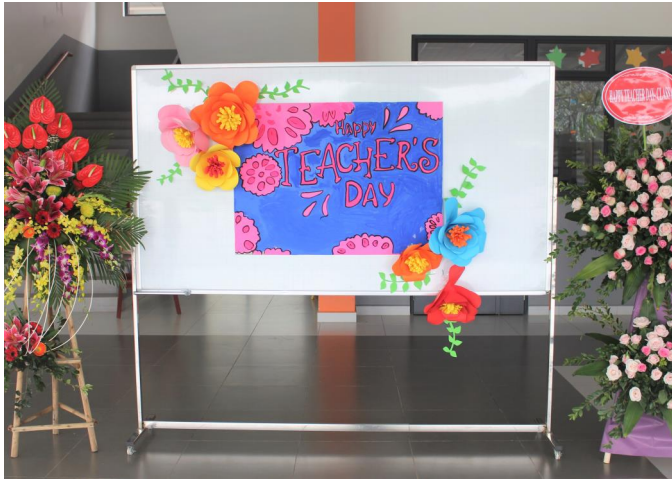
Ngày Nhà Giáo vui vẻ tại SIS @ Gamuda Gardens