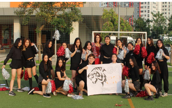
Đội cổ vũ đầu tiên của chúng ta và cô Hiệu trưởng.