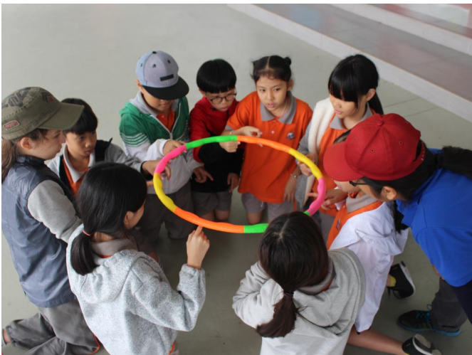
Hoạt động OBV thật là vui.