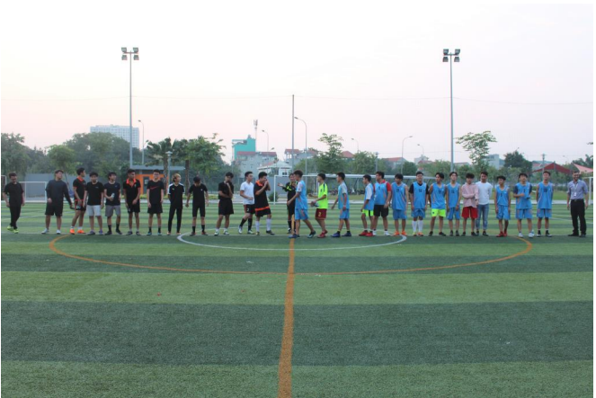
Đội bóng của chúng ta sau trận đấu với trường Hà Nội Academy school