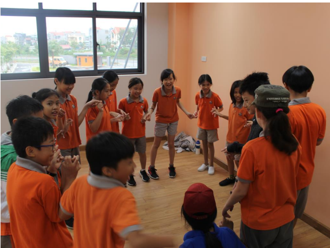
Học sinh tham gia các hoạt động trong chương trình OBV