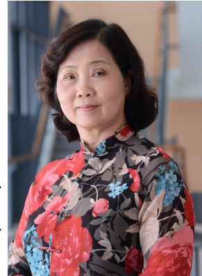
Các hoạt động OBV