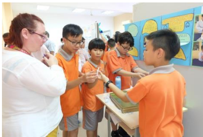
Thư từ Hiệu trưởng