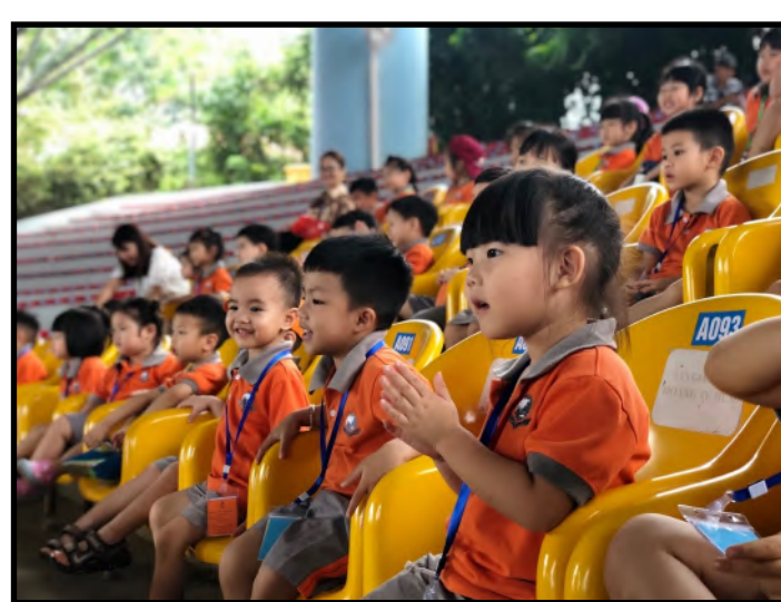
Các em học sinh Mầm non đang xem biểu diễn Cá heo

Cuối cùng, đội ngũ nhân viên Văn phòng chúng tôi luôn sẵn sàng giải đáp mọi thắc mắc của Phụ huynh. Quý Phụ huynh có thể liên hệ với Văn phòng trường bất cứ lúc nào về những vấn đề liên quan đến việc học tập của học sinh.