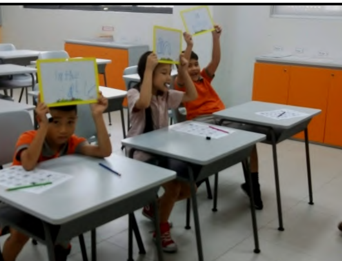
Học sinh lớp tiếng Anh tăng cường hào hứng sử dụng bảng trắng trong giờ học