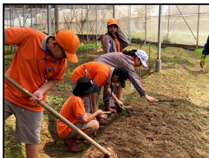
Các em học sinh Tiểu học và THCS trải nghiệm "Một ngày làm nông dân"