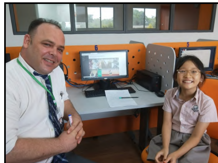
Học sinh đang giới thiệu website của mình