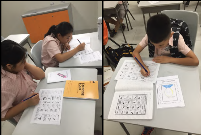
Các em học sinh lớp Tiếng Anh tăng cường đang được hỗ trợ thêm để có thể theo kịp chương trình