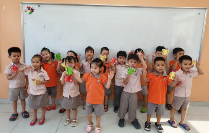
Các học sinh khối Mầm non tự hào khoe các sản phẩm thủ công sáng tạo của mình