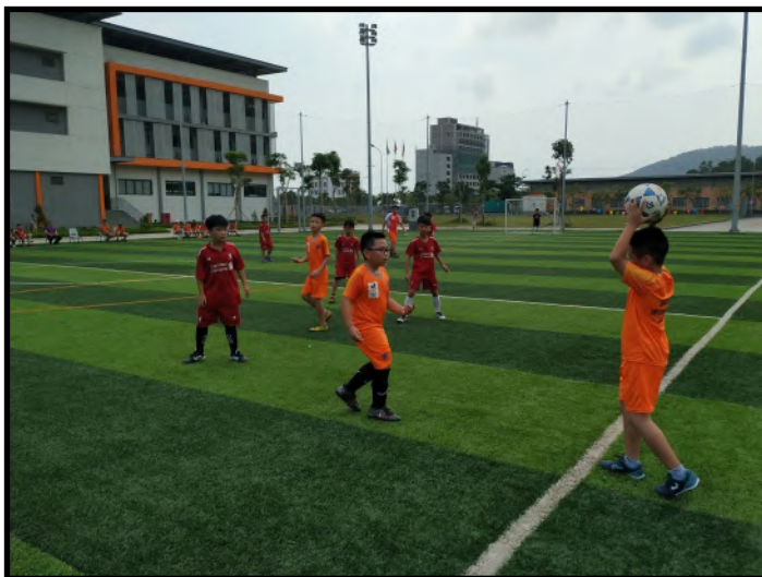
Một hình ảnh về sự phối hợp đồng đội!