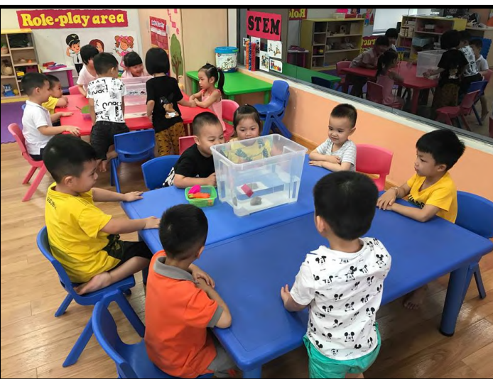
Các học sinh khối Mầm non đang tham gia hoạt động STEM