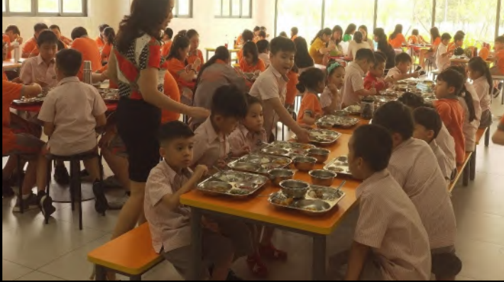
Trong thời gian gần đây, Nhà trường đã chú trọng nhiều hơn đến các quy tắc trong căng tin để rèn luyện cho các em học sinh cách hành xử phù hợp trong bữa ăn