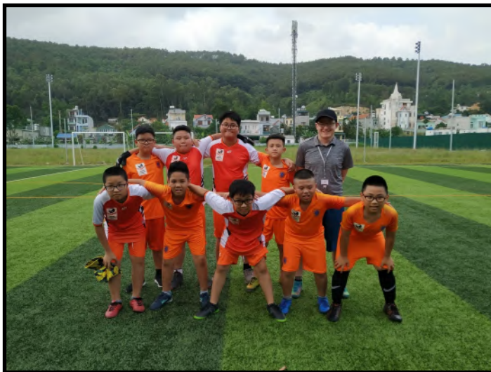
Nhưng người hùng thể thao nhí!

Tôi xin được gửi lời cảm ơn đến các Quý Phụ huynh, tuy rất bận rộn nhưng vẫn dành thời gian để cổ vũ các em, cũng như toàn bộ Ban giám hiệu và nhân viên trong trường đã giúp đỡ để trận đấu diễn ra thành công tốt đẹp.