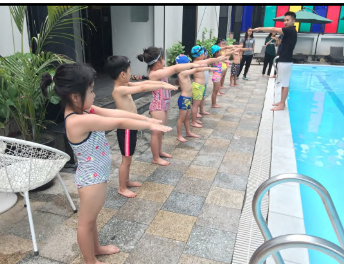
Học sinh lớp Dự bị tiểu học trong tiết học bơi