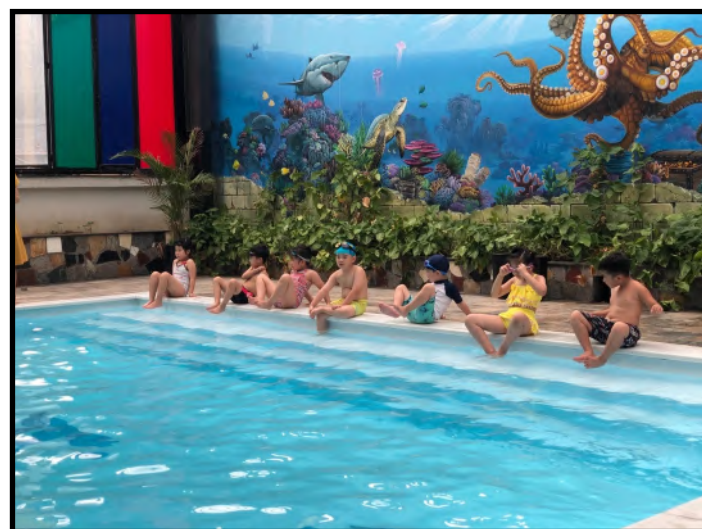
Các em học sinh Mầm non rất hào hứng với giờ tập bơi