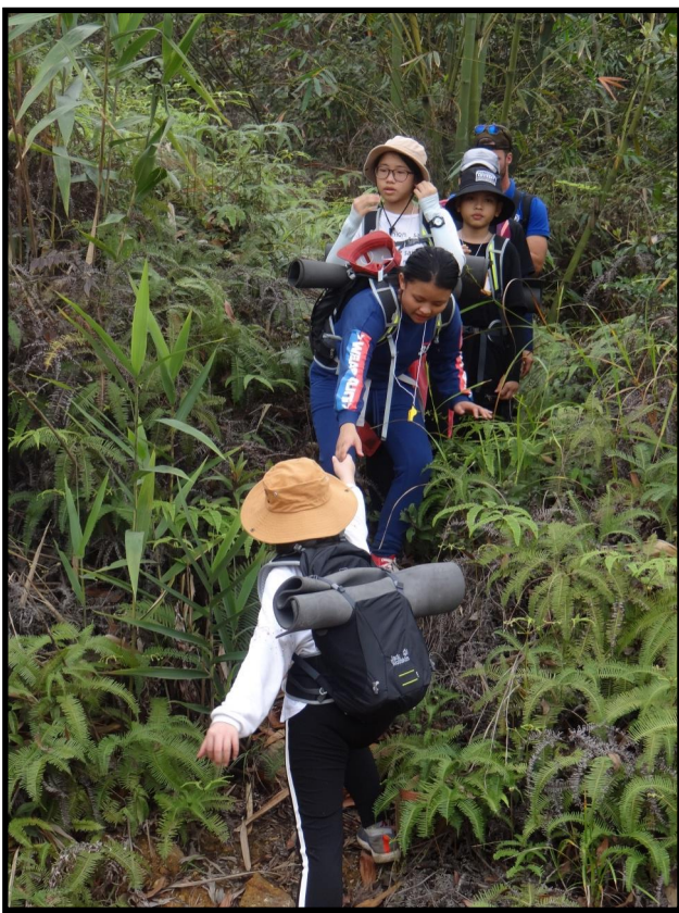
Hình ảnh các em học sinh học cách giúp đỡ lẫn nhau