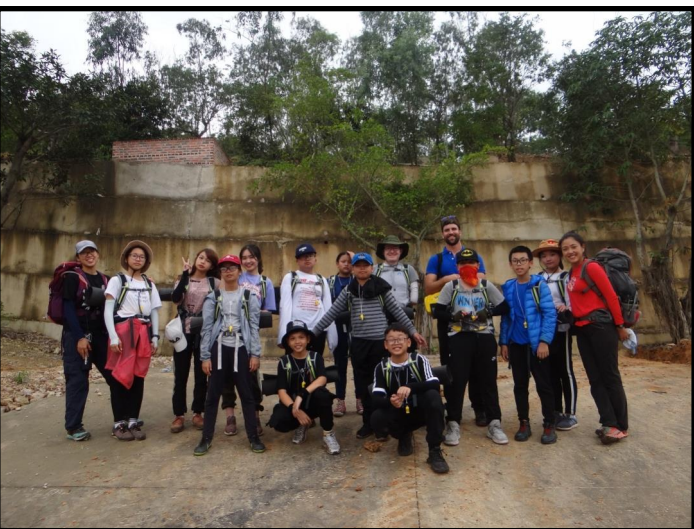
Ảnh chụp các em học sinh lớp 6 & lớp 7 đang tham gia hoạt động đi bộ đường dài