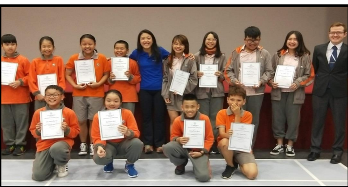
Các em học sinh lớp 6 & lớp 7 nhận chứng chỉ hoàn thành khóa đào tạo của OBV trong lễ chào cờ tại trường