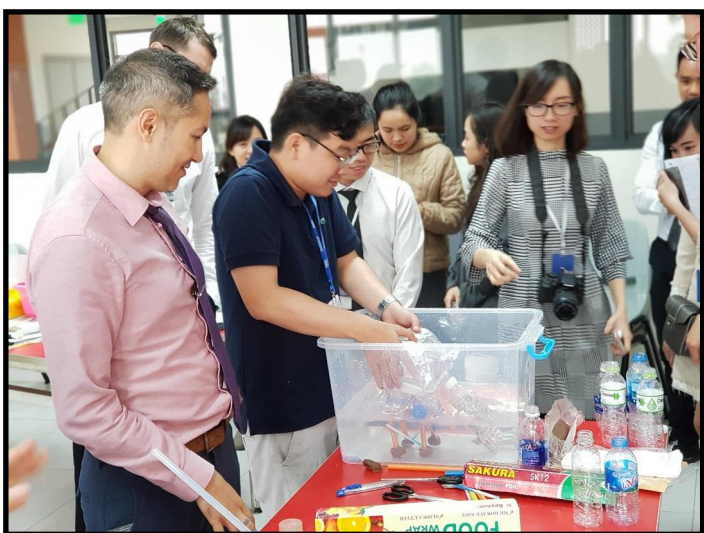
Các nhóm giáo viên đang cố gắng thực hiện dự án mẫu để tìm hiểu xem học sinh sẽ cần luyện tập như thế nào để đạt được giải thưởng.