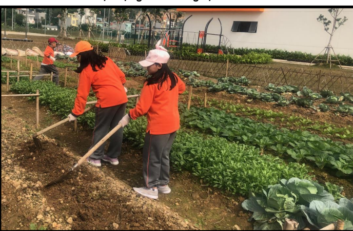
Các em học sinh tham gia làm vườn!