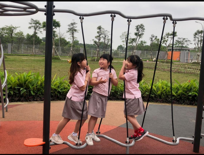
Hoạt động buổi sáng tại sân chơi