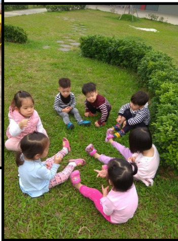
Các em học sinh mẫu giáo học kỹ năng vận động thô và tận hưởng không khí trong lành