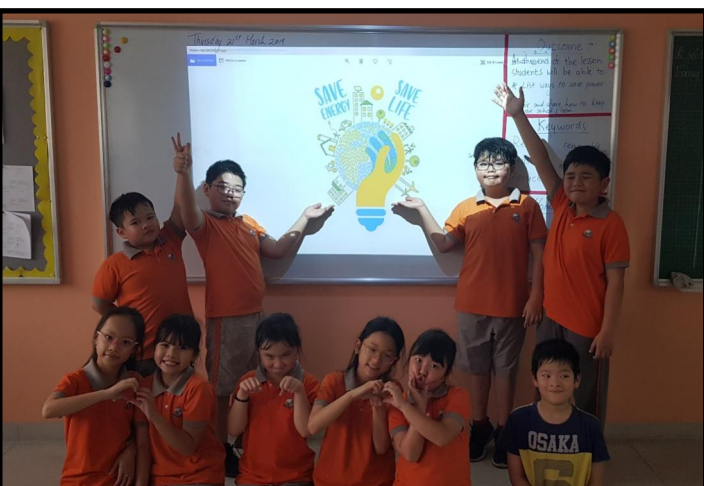
Lớp 3 đang thuyết trình một số ý tưởng cơ bản về tiết kiệm năng lượng và nước.