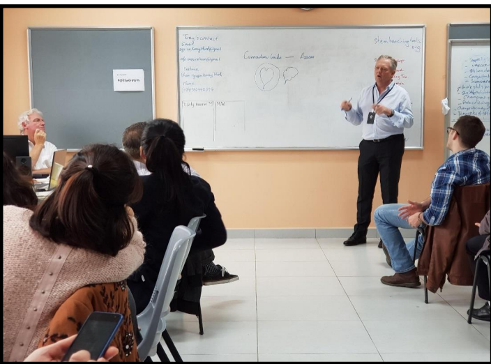
Giám đốc Học thuật của hệ thống SIS đang thảo luận với đại diện các trường SIS trên toàn quốc về cách thức trở thành những người tiên phong trong giải thưởng CREST