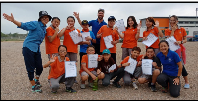
Các em học sinh vui vẻ nhận chứng chỉ đầu tiên về chứng chỉ cắm trại