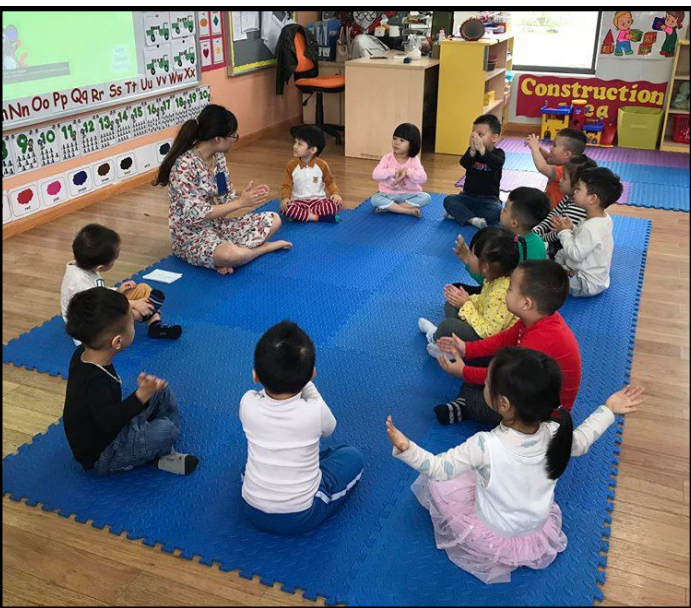
Các em học sinh mẫu giáo học tính tự kỷ luật giờ học chung