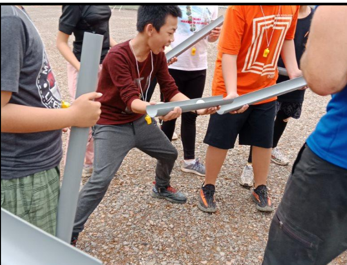
Các em học sinh hoạt động nhóm trong chương trình OBV