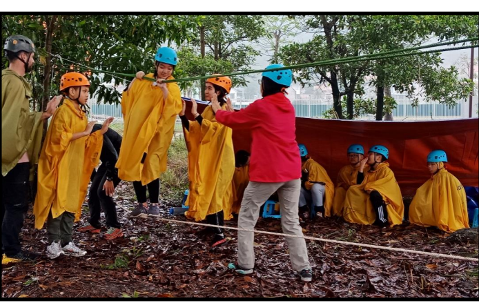
Thực hành kỹ năng giữ thăng bằng trên dây thừng thấp trong điều kiện ẩm ướt