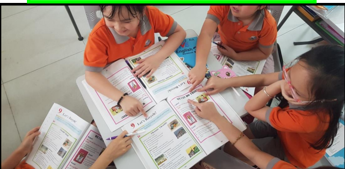
Thảo luận nhóm để cùng đưa ra và so sánh các ý tưởng bảo vệ môi trường.