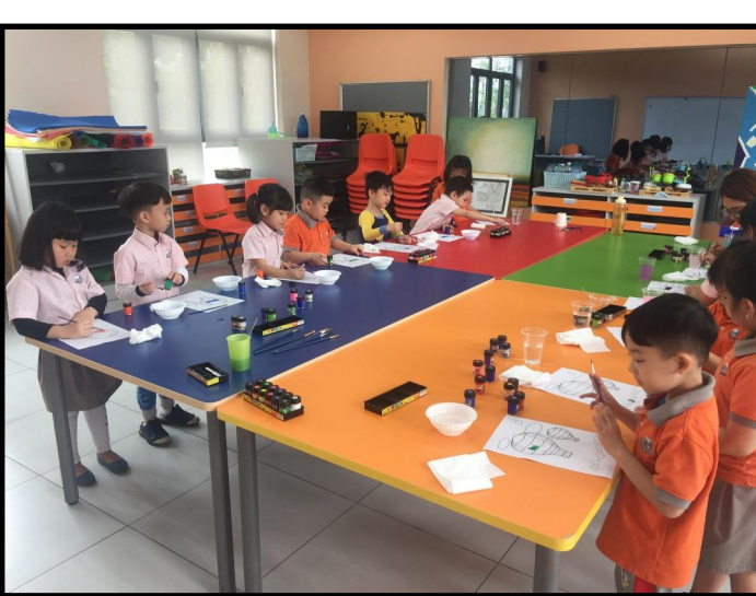
Các em học sinh mẫu giáo đang thực hành mỹ thuật