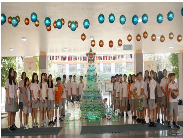
Dự án STEAM do các em học sinh Khối THCS Song Ngữ thực hiện