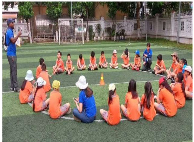
Hoạt động của các em học sinh Lớp 4 & 5 trong suốt khoá học OBV