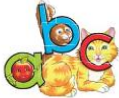
These colourful pictograms provide memory hooks for all the letter shapes and sounds.

Những câu chuyện đơn giản về các nhân vật trong Letterland giúp giải thích một cách sinh động các khái niệm ngữ âm khô khan, tạo sự hứng thú cho các con lắng nghe, suy nghĩ và học tập. Những câu chuyện này được xây dựng nên để giải thích âm vần, hình dạng của các chữ cái để giúp các con tiến bộ nhanh hơn trong việc ghép từ, đọc và viết.