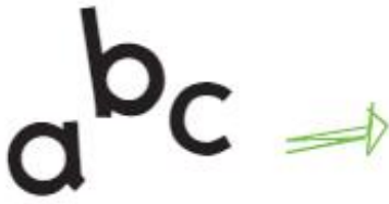
Abstract letter shapes are transformed into motivating and engaging pictogram characters.

Năm học này, Nhà trường bắt đầu đưa vào giảng dạy chương trình ngữ âm Tiếng Anh Letterland đến từ Anh Quốc. Letterland là chương trình độc đáo, dựa trên ngữ âm để dạy đọc, viết, đánh vần cho học sinh từ 3-8 tuổi. Các nhân vật trong Letterland thay đổi hình dạng từ chữ cái màu đen đơn giản trở thành các chữ tượng hình, thân thiện với trẻ em và các nhân vật đó cùng chung sống trong một thế giới tưởng tượng gọi là Letterland.