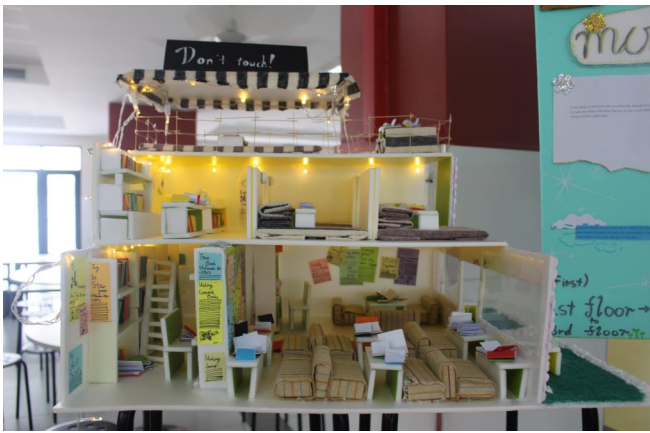
Những dự án ấn tượng được trưng bày tại sảnh