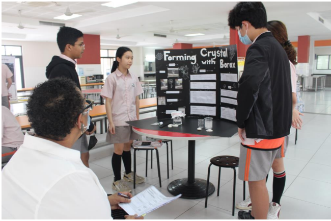
Các em học sinh hưởng ứng Cuộc triển lãm dự án