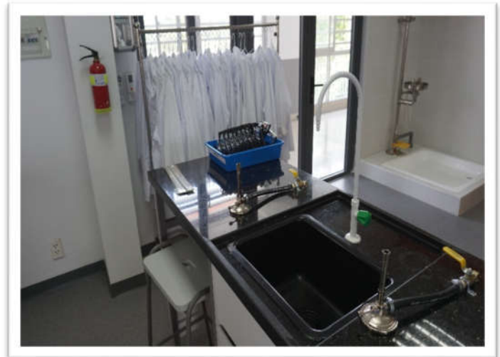
Phòng thí nghiệm của trường