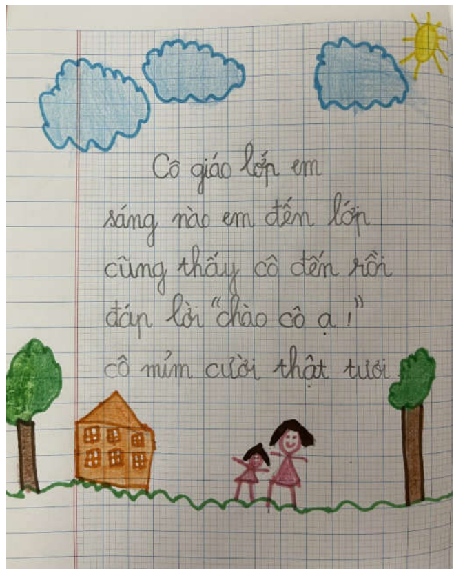
Hoạt động vẽ tranh, làm thơ tặng các thầy cô trong ngày Nhà giáo Việt Nam 20/11