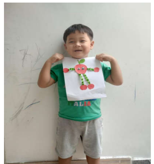
Các sản phẩm dễ thương của các em học sinh Khối mẫu giáo