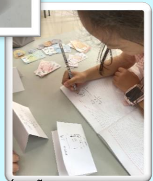
Đội tuyển Toán Lớp 2 Quốc tế

Thông qua hoạt động Cửa hàng Toán học hấp dẫn này, học sinh không chỉ trau dồi kỹ năng toán học mà còn phát triển những hiểu biết quan trọng về thế giới thực. Bằng cách thành lập cửa hàng đồ chơi của riêng mình, định giá cả và xử lý các giao dịch, các em đã có được kinh nghiệm thực tế về số học cơ bản, quản lý tiền và giải quyết vấn đề. Hơn nữa, việc thay phiên nhau làm chủ cửa hàng và khách hàng sẽ thúc đẩy sự cộng tác, giao tiếp và tư duy phản biện. Nhìn chung, phương pháp thực hành này không chỉ khiến việc học trở nên thú vị mà còn trang bị cho học sinh những kỹ năng sống có giá trị mà các em có thể áp dụng ngoài lớp học.